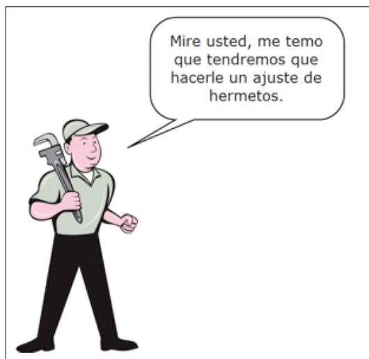
Figura 1. Problemas comunicacionales por el empleo de terminología 2 .

nología de su campo sin más explicación alguna? (Fig. 1). Probablemente, perplejos.